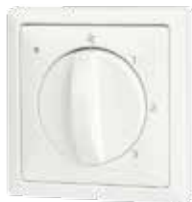
Standenschakelaar met filterindicatie